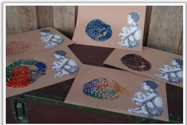
Lilani entdeckt ein besonderes Lebewesen – das Schuppentier