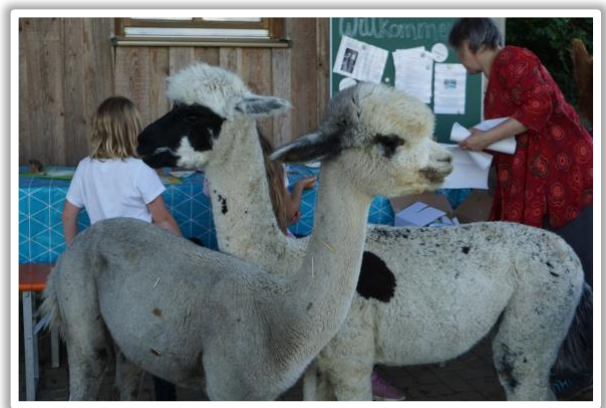
Die neugierigen Alpakas waren immer dabei.

Aufhänger und roter Faden an den Nachmittagen war das neueste Buch der Autorin. In der Erzählung „Lilani und das Schuppentier“ begegnet die junge Lilani auf ihrem Schulweg einem seltsamen Tier. Als sie es in ihr Dorf mitnimmt, wird es vom Dorfältesten konfisziert. Durch eine zufällige Begegnung lernt Lilani die Tierschützerin Maria kennen. Von ihr erfährt sie, dass das Schuppentier, auch Pangolin genannt, auf dem Schwarzmarkt für viel Geld gehandelt wird und deshalb vom Aussterben bedroht ist. Gemeinsam retten sie das schuppige Lebewesen.